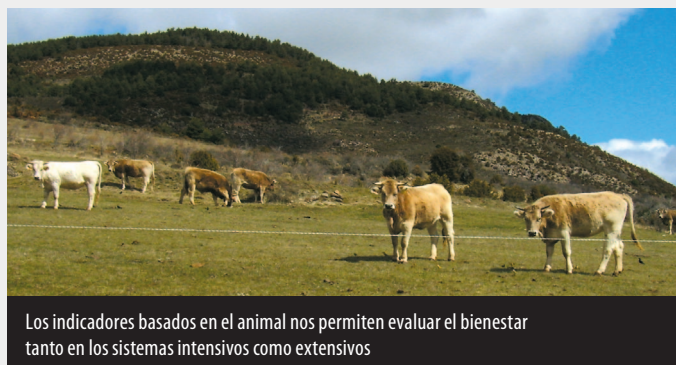
Los indicadores basados en el animal nos permiten evaluar el bienestar tanto en los sistemas intensivos como extensivos